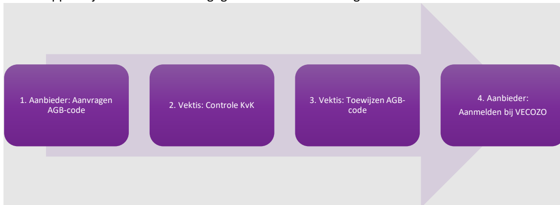
Figuur 1: Proces aanvragen AGB-code

Deze stappen zijn schematisch weergegeven in onderstaand figuur.