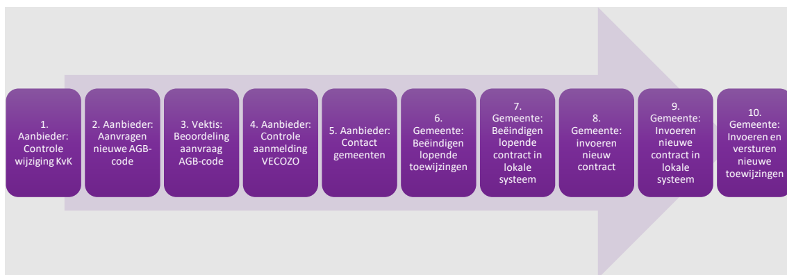
Figuur 2: Proces wijzigen AGB-code

Deze stappen zijn kort weergegeven in onderstaand schema.